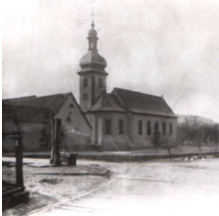
Die Dorfmitte um 1920